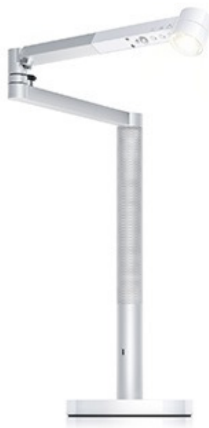
Dyson_Lightcycle Morph Desk_WeißSilber