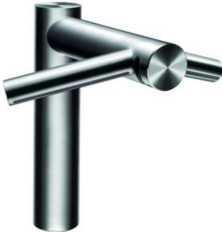
Dyson_Airblade Wash+Dry_Hohe Armatur