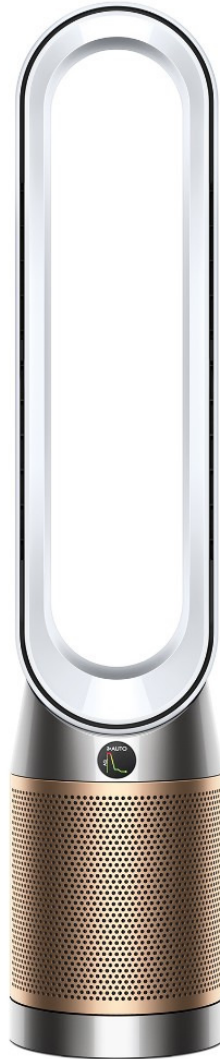
Dyson_Purifier Cool Formaldehyde

gedruckt am 15.10.2021 LB-HT-012+ABK-EDS-018 Preisangaben in EUR