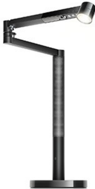
Dyson_Lightcycle Morph Desk_Schwarz