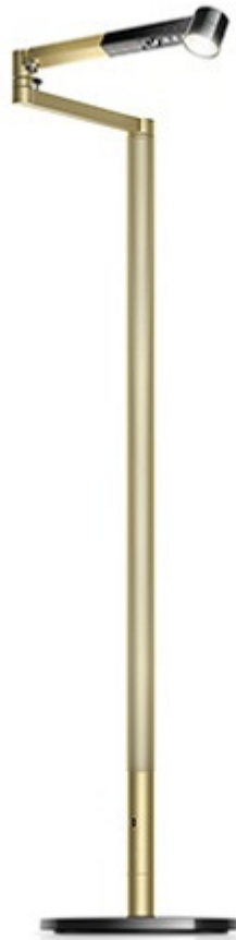
Dyson_Lightcycle Morph Floor_SchwarzMessing

LB-HT-012+ABK-EDS-018 Preisangaben in EUR